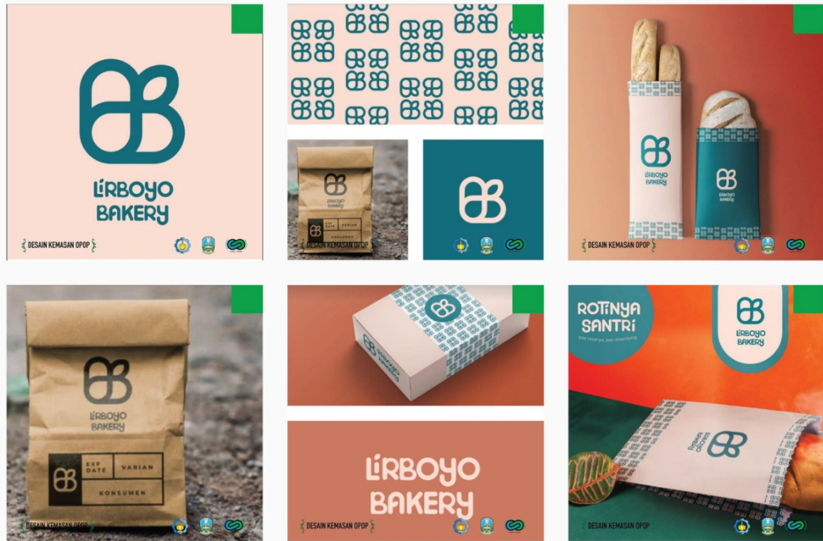
Desain Kemasan Lirboyo Bakery, salah satu karya desain tim Abmas Gerakan 1.000 Desain Kemasan dari ITS